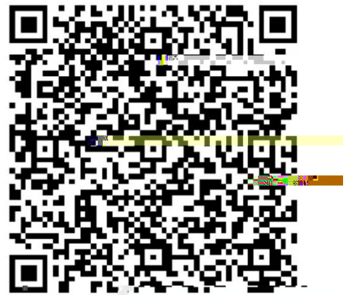
第二届全国大学生生命科学竞赛 闭幕式录像